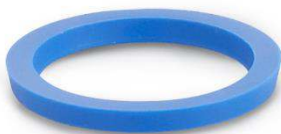
Joint d'étanchéité H-NBR Gamme Hygiénique