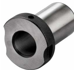
Canon amovible DIN 173