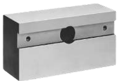
Butée parallèle fixe