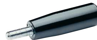
À tige filetée longue