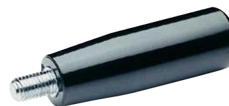
À tige filetée standard