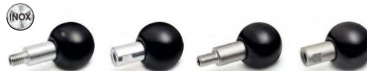
Tige filetée acier