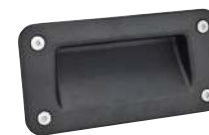
Fraisée, avec joint