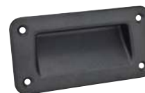
Fraisée, sans joint