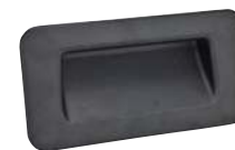
A tige filetée