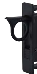
Sortie - l_1 = 81 mm