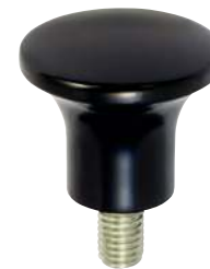
À tige filetée