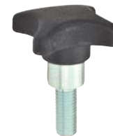
Tige filetée inox