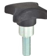
Tige filetée acier