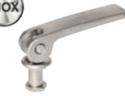
Avec levier à excentrique