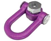
M36 et M42