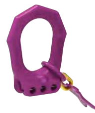
4 mm, 1 ou 2 brins