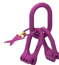
4 mm, 4 brins