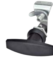
Poignée en T