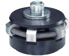
Segment de serrage