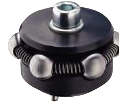
Bille de serrage