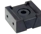
Mors lisse taraudé