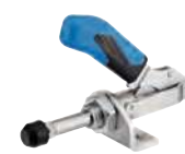
Poignée bleue, avec équerre