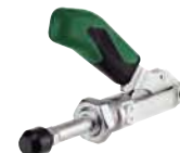
Poignée verte, sans équerre