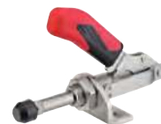
Poignée rouge, avec équerre