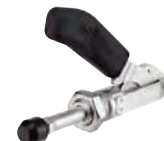
Poignée noire, sans équerre