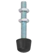
Acier, avec patin arrondi