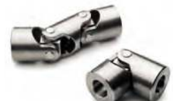
Inox, palier lisse