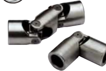
Acier, palier lisse