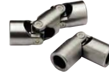
Acier, roulement à aiguilles