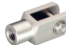
Avec axe et circlips