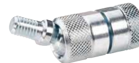
À tige filetée, rotule mâle