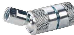
Taraudé, rotule femelle