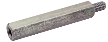
Mâle - Femelle