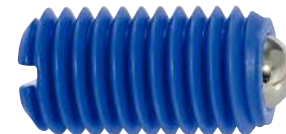
À bille inox