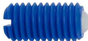
À bille polyacétal