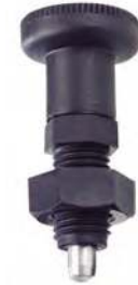
Inox avec écrou