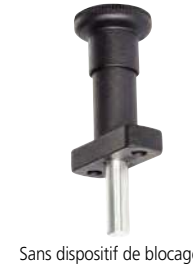
Sans dispositif de blocage