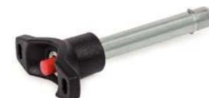
Acier avec poignée en T