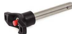
Inox avec poignée en T