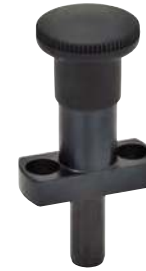
Sans dispositif de blocage