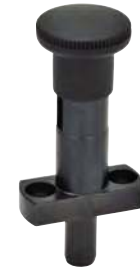
Avec dispositif de blocage