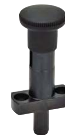
Avec dispositif de blocage