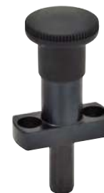
Sans dispositif de blocage