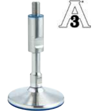
Sans trous de fixation