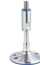
Avec trous de fixation