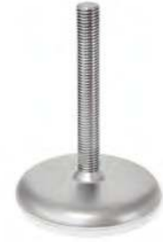
Semelle blanche, M16 à M30