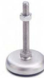
Semelle noire, M8 à M12