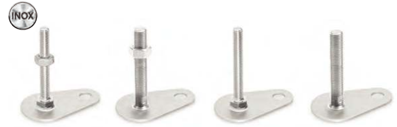
Avec écrou, M8 à M12 Avec écrou, M16 à M24 Sans écrou, M8 à M12 Sans écrou, M16 à M24