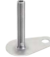
Avec 6 pans creux, sans écrou