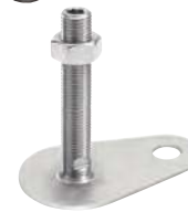
Avec 6 pans creux, avec écrou