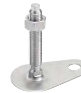
Avec méplat, avec écrou