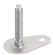
Avec méplat, sans écrou