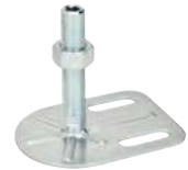
2 trous, M16 à M24