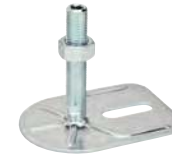
1 trou, M16 à M24