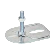
1 trou, M8 à M12