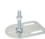
2 trous, M8 à M12