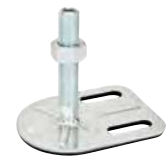
2 trous, M16 à M24