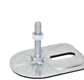
1 trou, M8 à M12