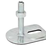
1 trou, M16 à M24