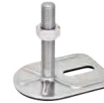
1 trou, M16 à M24