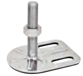
2 trous, M16 à M24