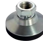
Acier, embase élastomère