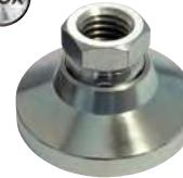
Acier, embase delrin