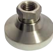
Inox, embase delrin