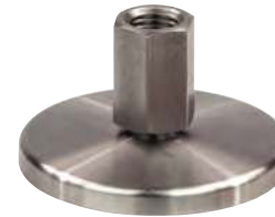
Sans trou de fixation