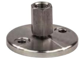
Avec trous de fixation