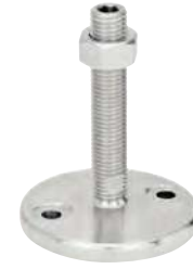
Avec trous de fixation