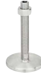
Sans trou de fixation