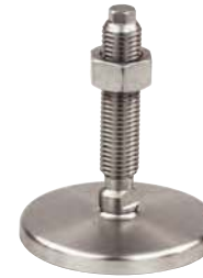
Sans trou de fixation