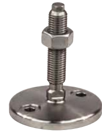
Avec trous de fixation