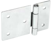
Acier, percée, asymétrique