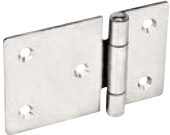
Inox brut, fraisée, asymétrique