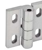
Gris, ajustement horizontal