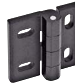
Noir, ajustement vertical - horizontal