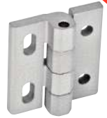
Gris, ajustement horizontal - fixe