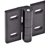
Noir, ajustement vertical