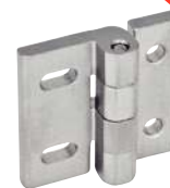
Ajustement vertical - fixe