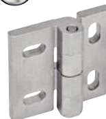
Ajustement vertical - horizontal