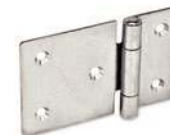
Inox, non percée, large