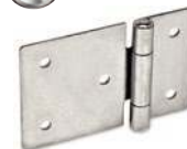
Acier, percée, asymétrique