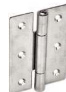
Inox, non percée