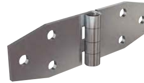
Nœud à plat