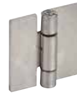
Inox 304, à plat