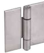
Acier, à plat