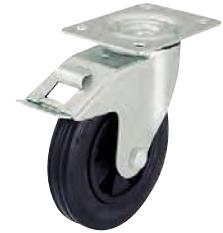
Avec frein arrière