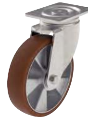
Pivotante, sans frein