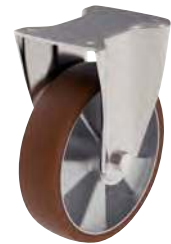
Fixe, sans frein