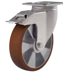
Pivotante, avec frein arrière