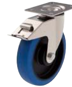
Pivotante, avec frein arrière