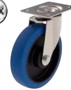
Pivotante, sans frein