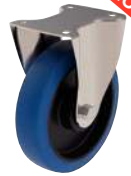
Fixe, sans frein