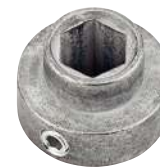
Palier de maintien