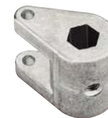
Levier de commande