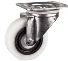
Pivotante, sans frein