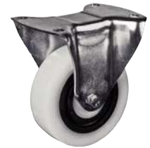
Fixe, sans frein