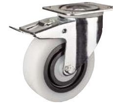
Pivotante, avec frein arrière