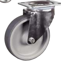
Pivotante, sans frein