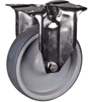
Fixe, sans frein