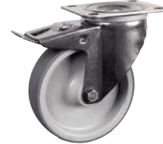
Pivotante, avec frein arrière