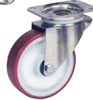
Pivotante, sans frein