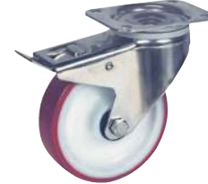
Pivotante, avec frein arrière