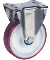
Fixe, sans frein